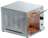
Roller Breakfast VV