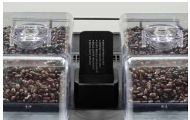
10 Double grinder and Decaf shute Doppio macinino + decaffeinato