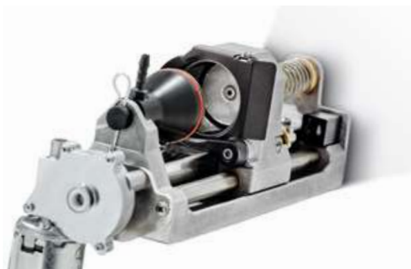
4 Easy maintenance Manutenzione semplice