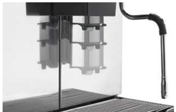
7 Height-adjustable spout Becco erogatore regolabile