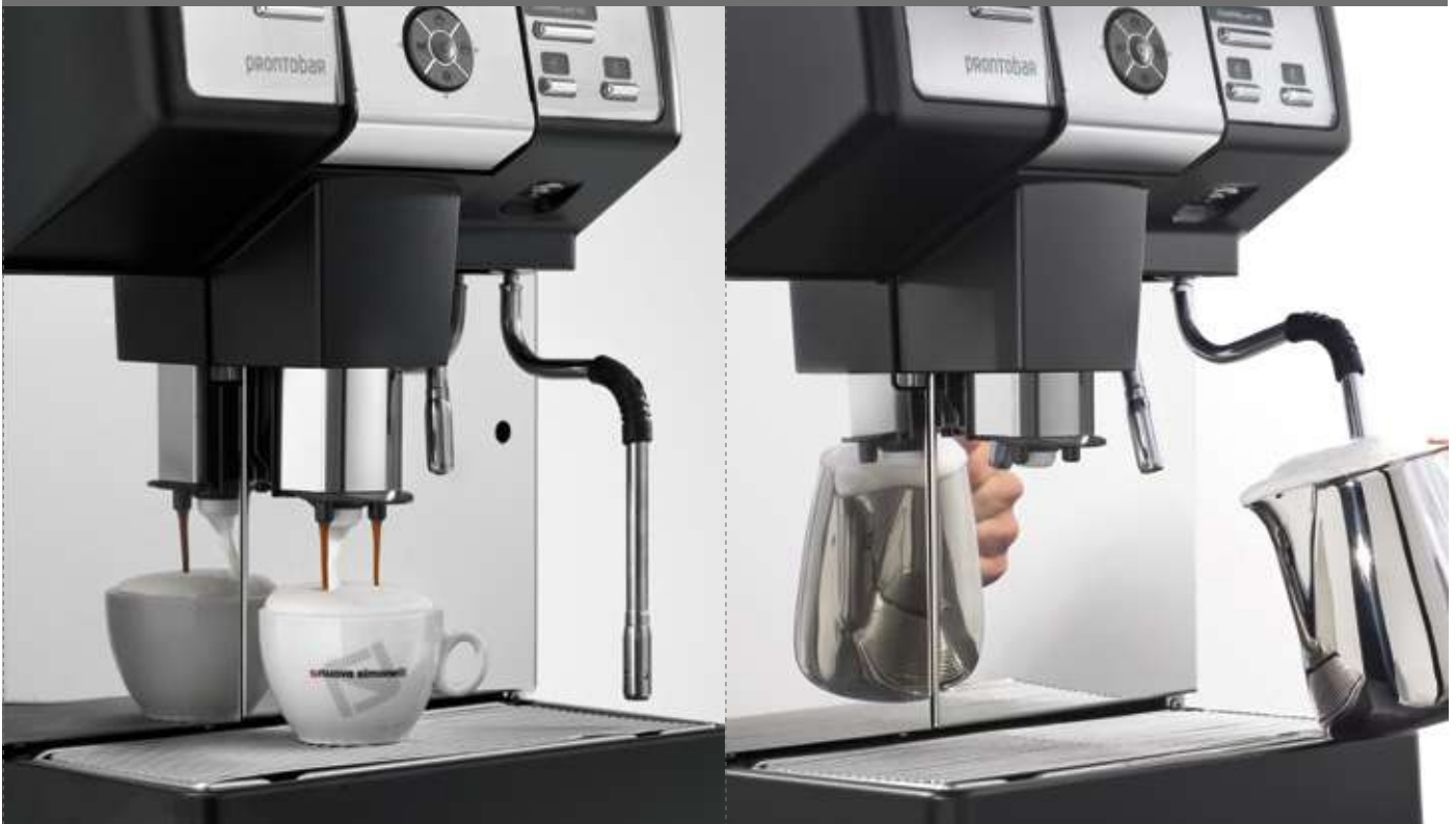
G 1 step / 1 step