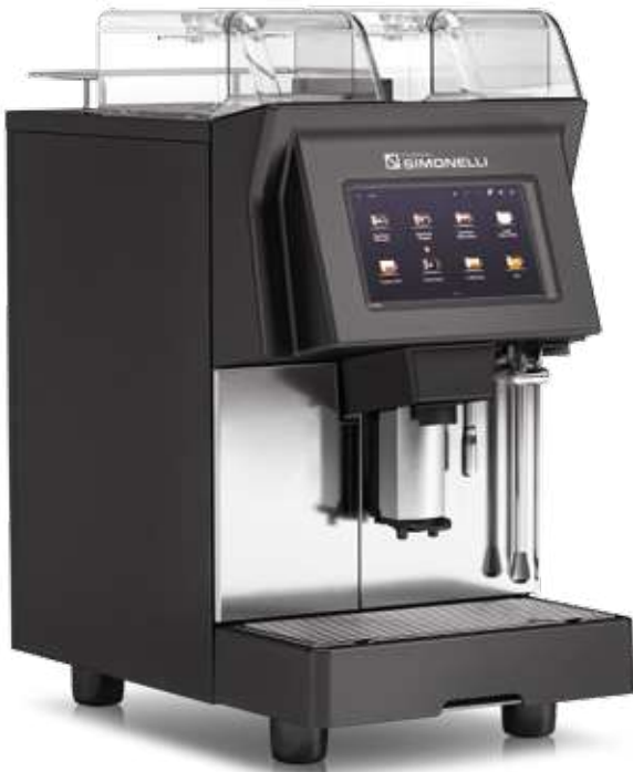
A PRONTOBAR TOUCH