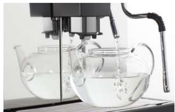
5 Hot water Acqua Calda