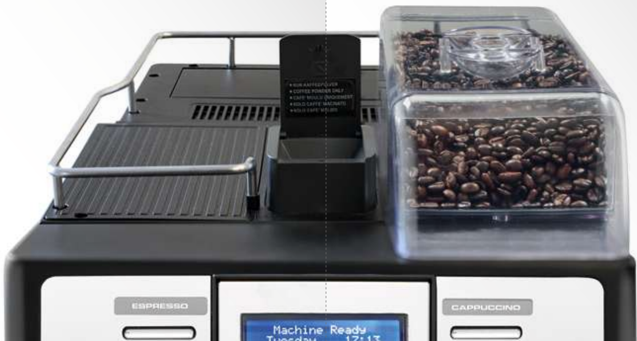
C 1 grinder / 1 macinino