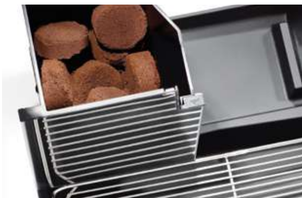
3 Large coffee ground container Ampio cassetto fondi