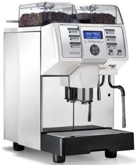
B PRONTOBAR SILENT