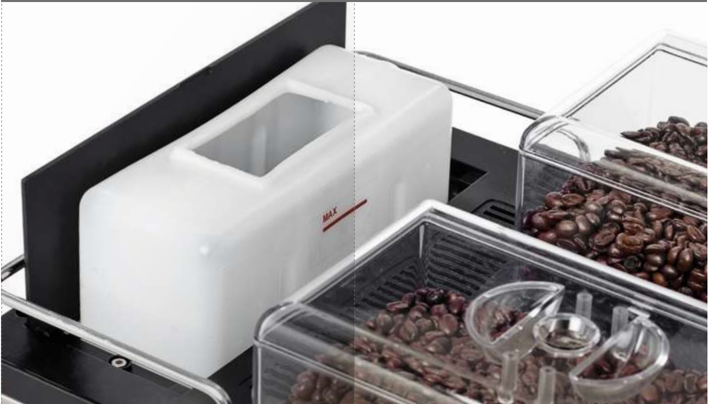
E Water tank / Serbatoio acqua