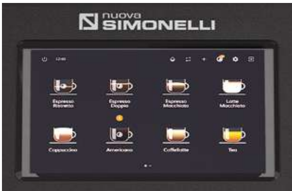
2 Touch Display 7" Display touch 7"