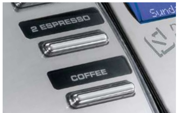
9 Customizable product labels Etichette personalizzabili