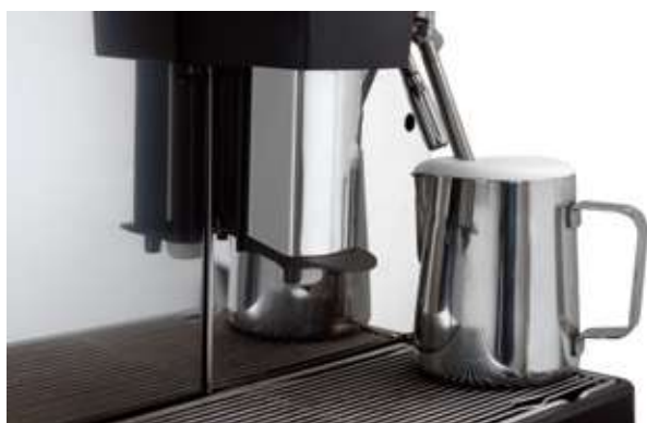
6 Easycream Technology Tecnologia Easycream