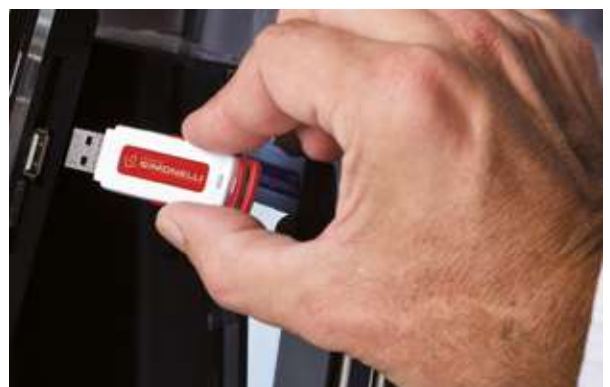
8 USB connection Porta USB