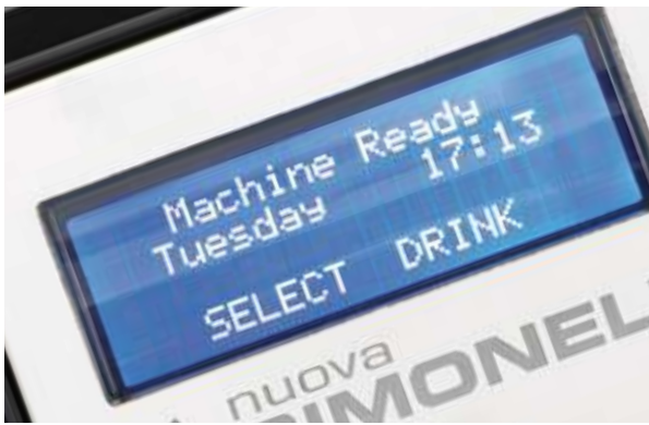
1 Alphanumeric LCD display Display LCD alfanumerico