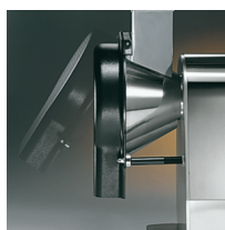
ABS guard with micromagnet on disc holder opening