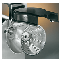
Removable grating discs